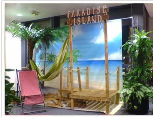
Fresque & Ponton