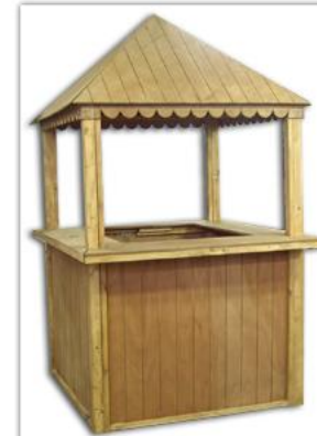
& Paillote simple