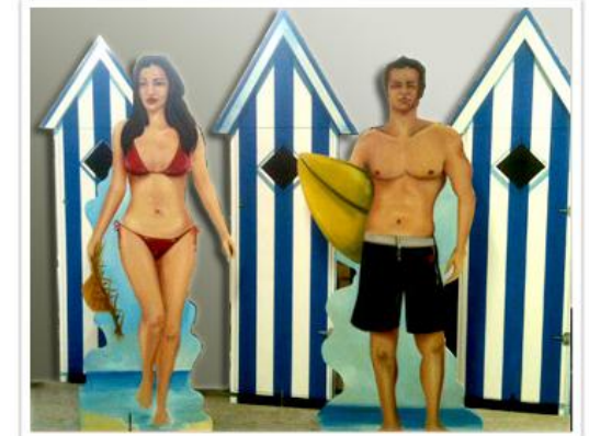
Silhouettes bois personnages & cabine de plage