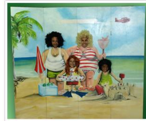
Paravent photo plage