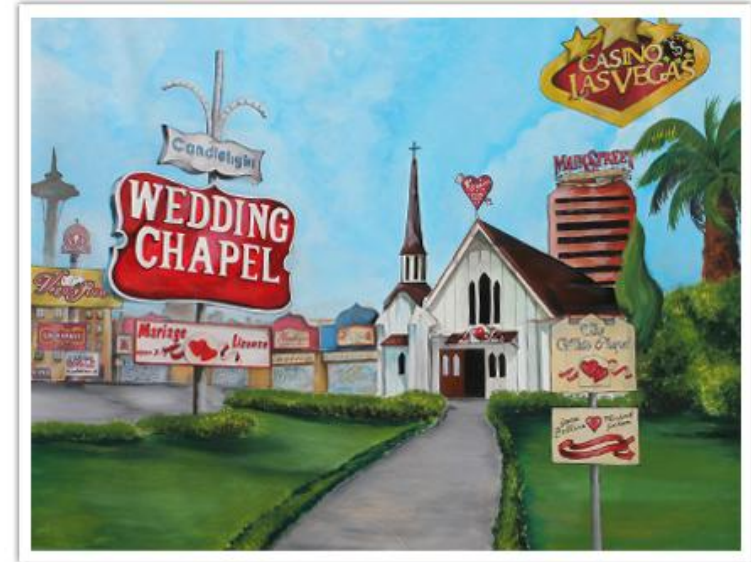
Fresque « Wedding Chapel »