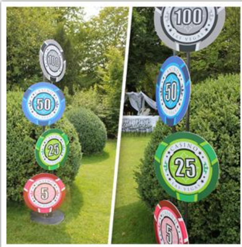
Totem jetons de casino