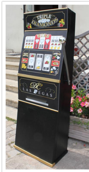
Silhouette machine à sous