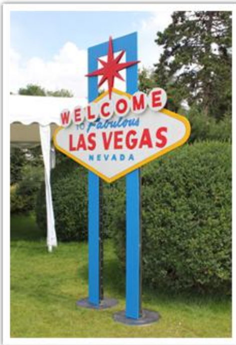
Enseigne «Welcome to Las Vegas »