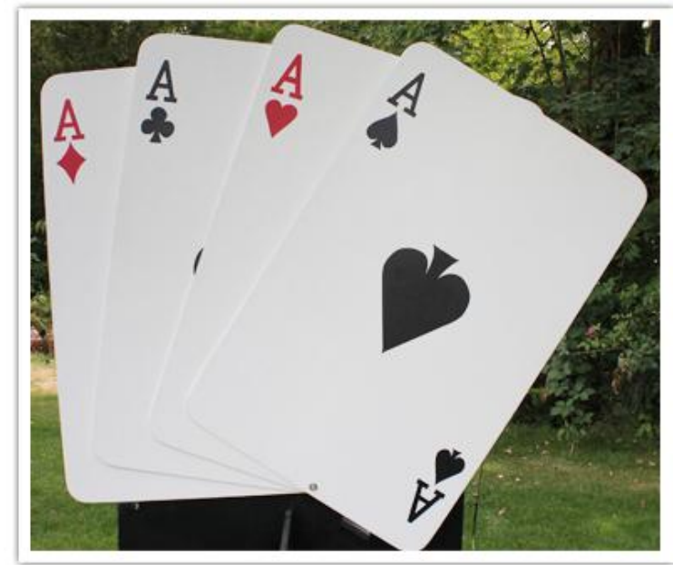
Cartes à jouer géantes