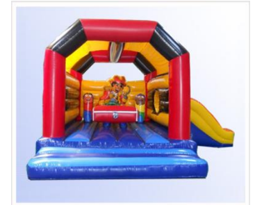
> Château Toboggan Encombrement : 5m X 5,5m X H3.25m

Fiche technique : 1 structure gonflable, le gonfleur électrique 220V (prévoir 1 arrivée électrique).