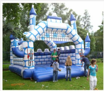
> Château Fort Encombrement : 5m x 6m x H6m