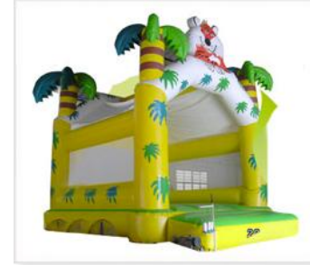
> Château Tigre Capacité : 8 à 10 enfants