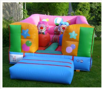
> Mini Cirque Encombrement : 4m x 3m x H2,20m