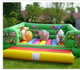
> Espace Jungle Encombrement : 6m x 6m x H2,50m