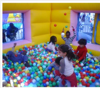
> Maison à boules Encombrement : 4m x 5m x H5m