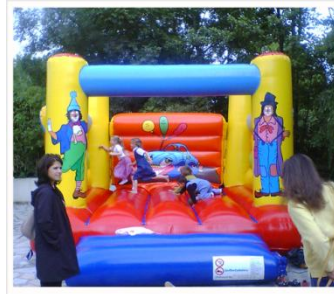
> Petit Château Clown Encombrement : 4,50m x 4,10m x H3,10m