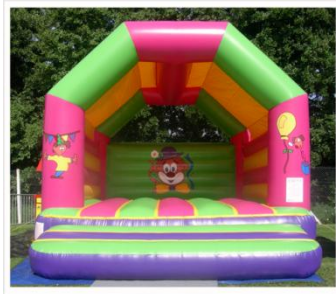
> Grand Château Clown Encombrement : 5m x 6m x H5m