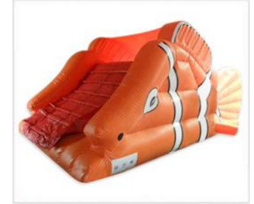
> Château Poisson Capacité : 8 à 10 enfants