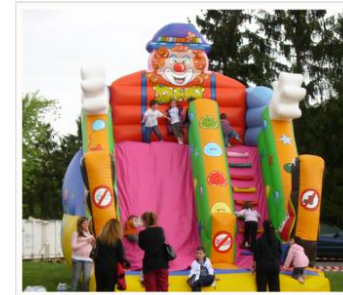
> Toboggan Clown Encombrement : 6m x 4,50m x H6m